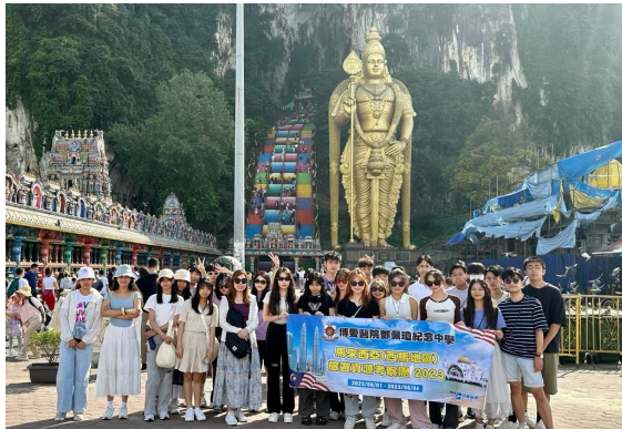
馬來西亞（西馬地區）旅遊資源考察團