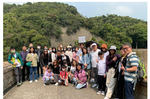
35周年校慶親子旅行