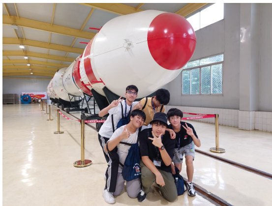
動火箭-航天夢之旅(西昌)