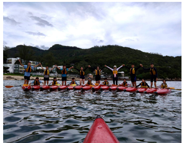
獨木舟三星證書訓練營