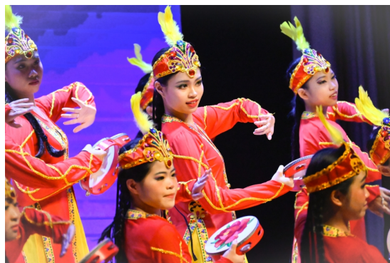
35周年校慶才藝表演晚會