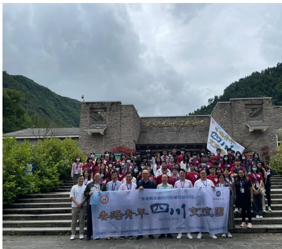
香港青年四川交流團

疫後復常，本學年大部分課外活動及學界比賽復辦，總括活動數量已大致回復到疫情前，超過200個。為幫助學生在學業及身心健康得到均衡發展，學校讓學生參與50多個學校校隊、學會訓練、義工隊服務以及多項校外比賽等。